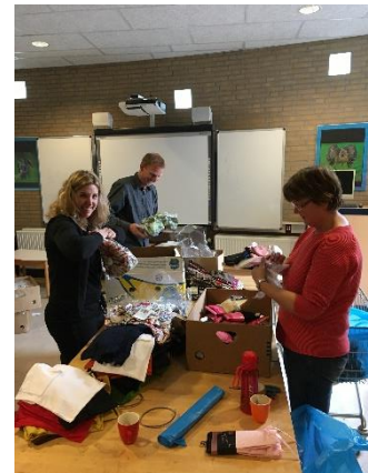
Foto hiernaast laat de leging zien van de laatste drie dozen kleding waarover u ook op Facebook heeft kunnen lezen.

De kledinginzameling loopt enorm. U kunt tot en met donderdagochtend 9.00 uur kleding inleveren op school. Deze ochtend worden de vele zakken opgehaald. We schatten dat ongeveer 9m3 meter kleding ingezameld is. We zijn benieuwd naar hoeveel kilo kleding dit is en wat het bedrag is dat hiermee is ingezameld voor het goede doel. 'Amref Flying Doctors' Deze organisatie zet zich in voor een duurzaam gezonder Afrika.